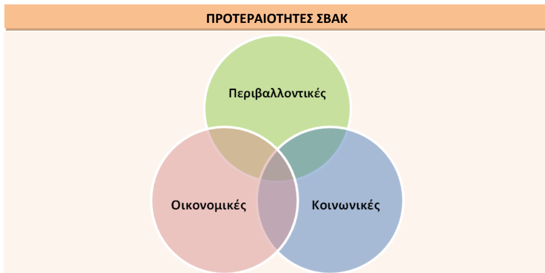
Εικόνα Error! No text of specified style in document.-1: Προτεραιότητες ΣΒΑΚ

Εντός του παραπάνω πλαισίου σχετικά με το ΣΒΑΚ Δήμου Δελφών αναπτύσσονται ορισμένες προτεραιότητες (βλέπε Πίνακα παρακάτω) κατηγοριοποιημένες ανάλογα με τη διάσταση της βιωσιμότητας στην οποία αναφέρονται, εμπεριέχοντας τις προαναφερθείσες θεματικές ανά κατηγορία, δηλαδή: